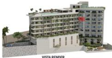
VISTA RENDER MI S Vallarta Nayarit Compostela